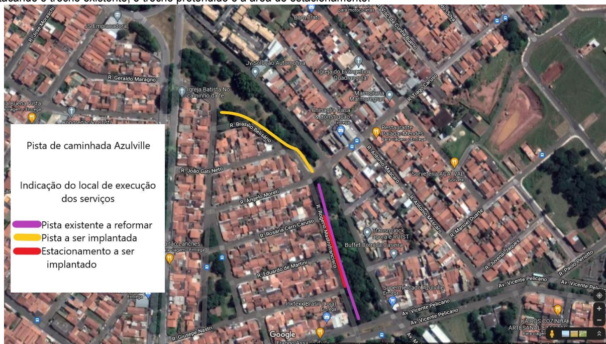
Figura 1: Indicação do local de execução dos serviços

2.1. Há alguns anos foi implantada uma pista de caminhada ao longo da rua Rogério Mastrofrancisco, contando com iluminação, bancos e academia ao ar livre. Os moradores da região demandam a manutenção e revitalização desta área, com a implantação de estacionamento de veículos, recuperação da iluminação e do calçamento danificado. Também pedem a ampliação da pista, que se estenderia longo da rua Brasília Belisário, equipada também com iluminação e bancos. A figura 1 indica o local, destacando o trecho existente, o trecho pretendido e a área de estacionamento.