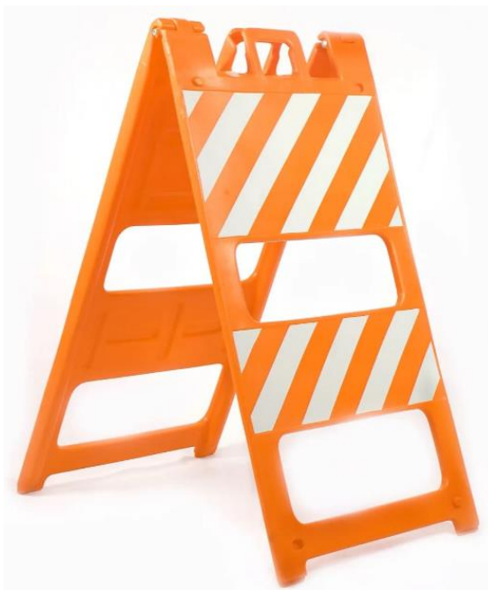
Modelo de Cavalete 2

Cavalete plástico dobrável, confeccionado em Polietileno de média densidade, na cor laranja, com proteção contra raios UVs, altura aprox. de 1,15 m e largura aprox. de 0,62 m; peso entre 05 e 08 kg. O Cavalete deverá possuir na parte central superior 01 alça anatômica de aprox. 0,07 x 0,11m para facilitar o transporte e, ao lado da alça, berços próprios para fixação de sinalizador luminoso, confeccionados na própria peça; Sua base deverá possuir no mínimo 04 pés de apoio, para melhor fixação ao solo, evitando deslocamentos involuntários. O Cavalete deverá ser articulado na parte superior por 02 parafusos sextavados zincados com 02 arruelas lisas e porcas autotravante. Cada face do Cavalete deverá possuir 02 rebaixos, sendo 01 superior medindo aprox. 0,60 x 0,30 m e 01 inferior medindo aprox. 0,60 x 0,20 m. Nas áreas rebaixadas deverá ser aplicada película refletiva autoadesiva na cor laranja/branca, conforme normas da ABNT NBR de refletividade e de acordo com a Resolução 160/04 do CONTRAN. O cavalete deverá possuir um compartimento para preenchimento com água ou areia a fim de aumentar a sua resistência contra o vento ou deslocamento de ar provocado por veículos em movimento. O mesmo deve ser personalizado, com a inscrição "TRANSITO" em preto, através de adesivo ou serigrafia.