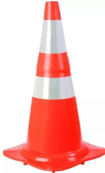
Modelo Cone 1

superior e a inscrição “TRÂNSITO”, em letras na cor preta no colar inferior. O cone deve estar de acordo com a NBR 15.071/15, conforme especificado pelo Anexo II CTB.