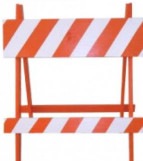
Modelo de Cavalete 1