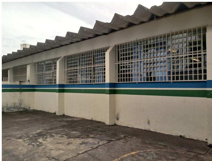
Local de ampliação do refeitório

Reforma e Ampliação da EMEB Janete Maria Martinelli Lia