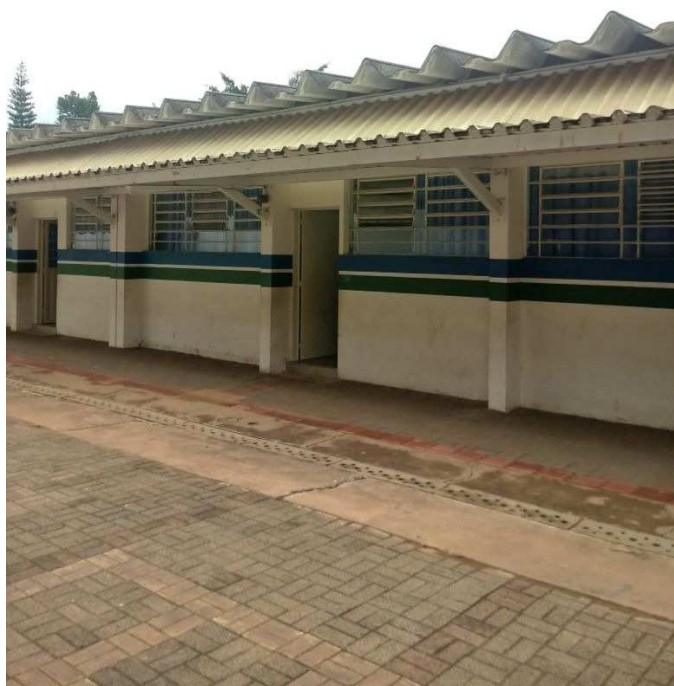
Cobertura de marquise a ser regularizada