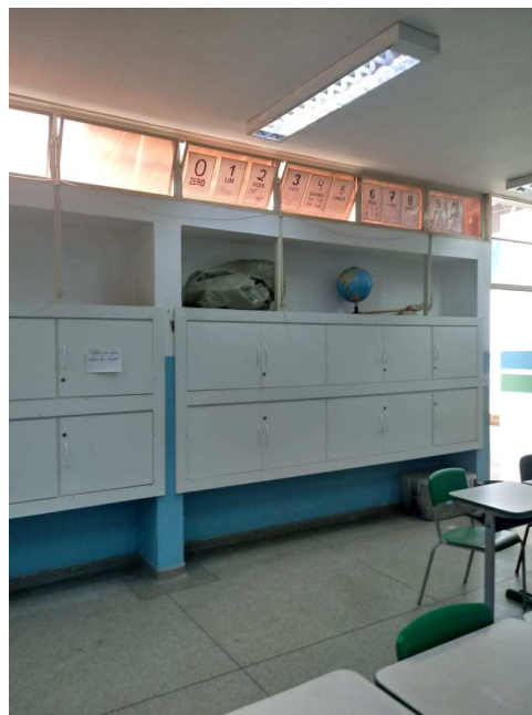
Sala de aula existente no local, a ser utilizada como modelo para a nova sala de aula