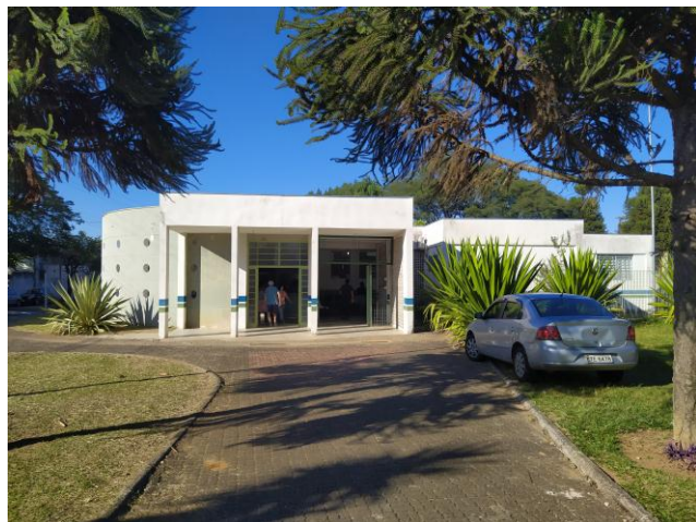
FACHADA DA UNIDADE

Segue relatório fotográfico atualizado. Ressaltamos que essas fotos não eximem a empresa licitante de realizar vistoria presencial no local, acompanhada de servidor da Secretaria de Saúde para conhecimento detalhado da situação do imóvel e pormenores dos serviços, antes da apresentação da proposta.