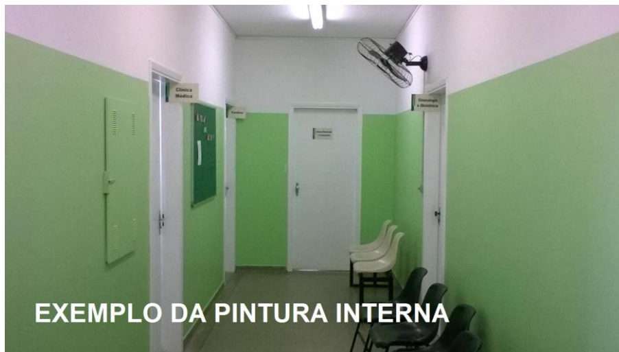
EXEMPLO DA PINTURA INTERNA