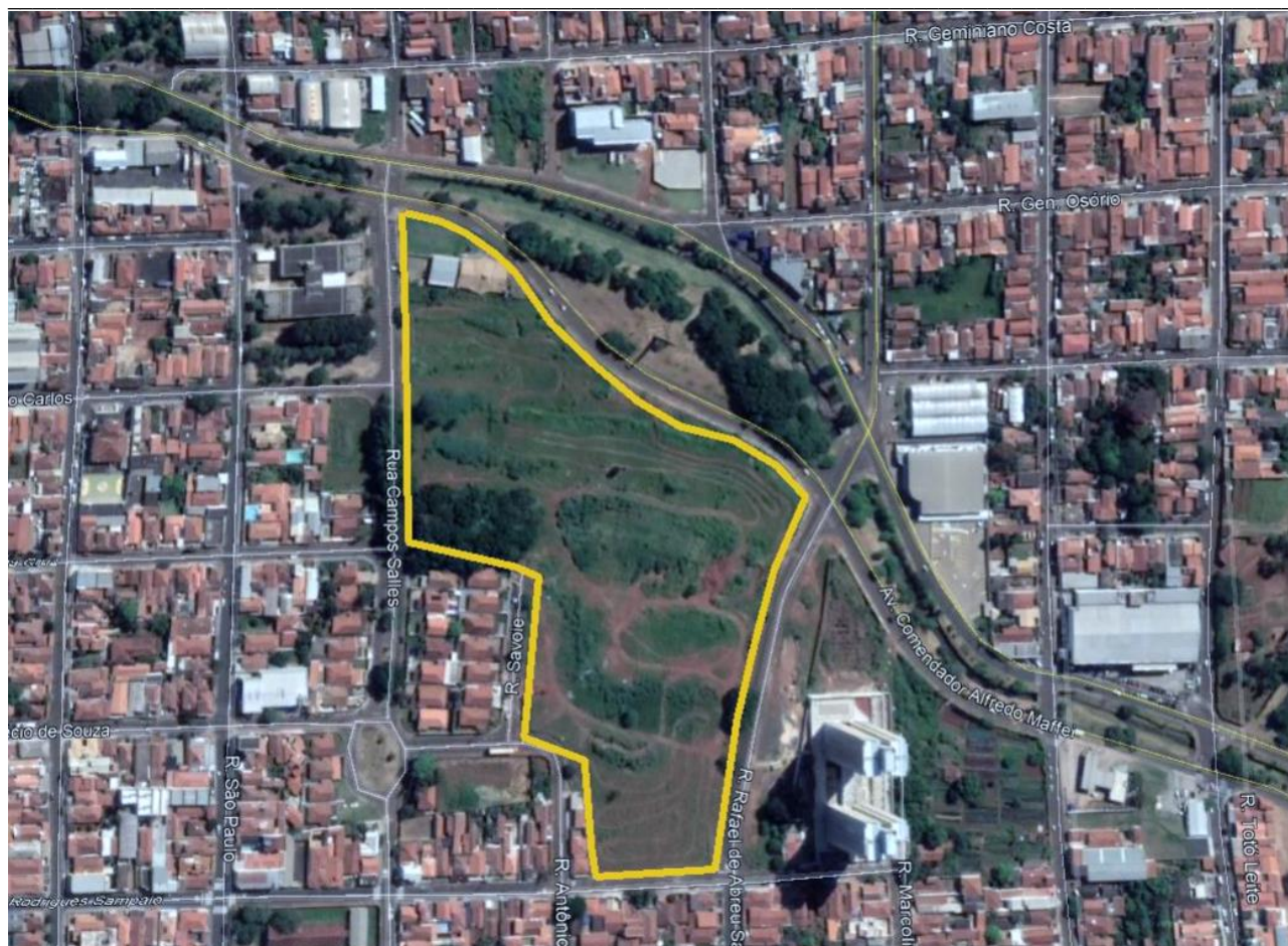
Figura 7 - Área de estudo para a implantação do reservatório de amortecimento

O reservatório deverá ocupar uma parte, a ser definida pela SMH DU e SMOP, do terreno. Vale destacar que a referida área é uma área de propriedade particular que, salvo melhor juízo, está em processo de negociação para posterior transferência ao município, portanto, para a definição da área de implantação e do volume do reservatório, além de considerar a área de influência da Bacia de contribuição, também deverá ser considerada a disponibilidade de área.