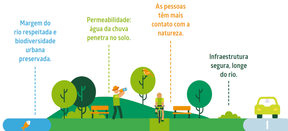
Figura 9 – Exemplo esquemático de SBN