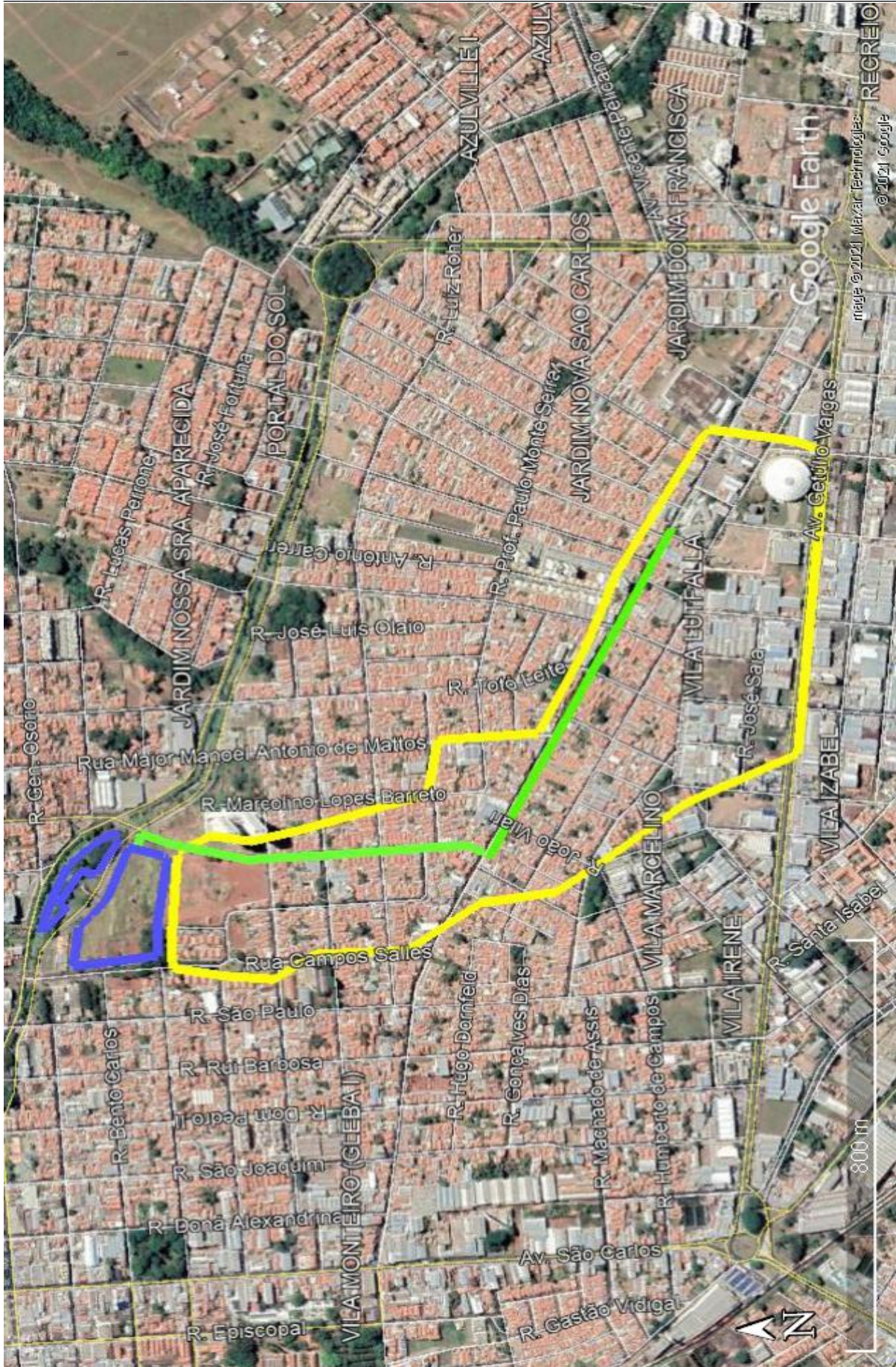
Figura 8 - Área de estudo para a implantação do reservatório de amortecimento