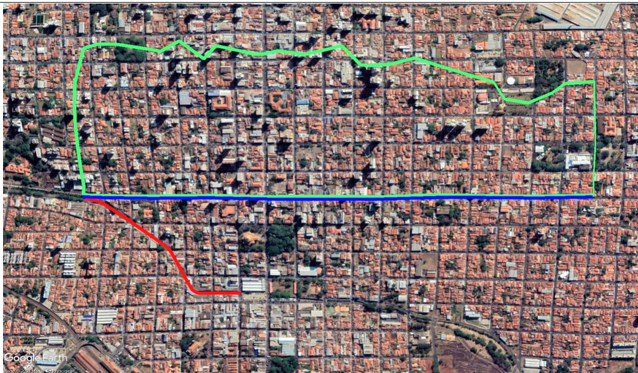
Figura 4 – Galeria na Rua Major José Inácio (Linha Azul)