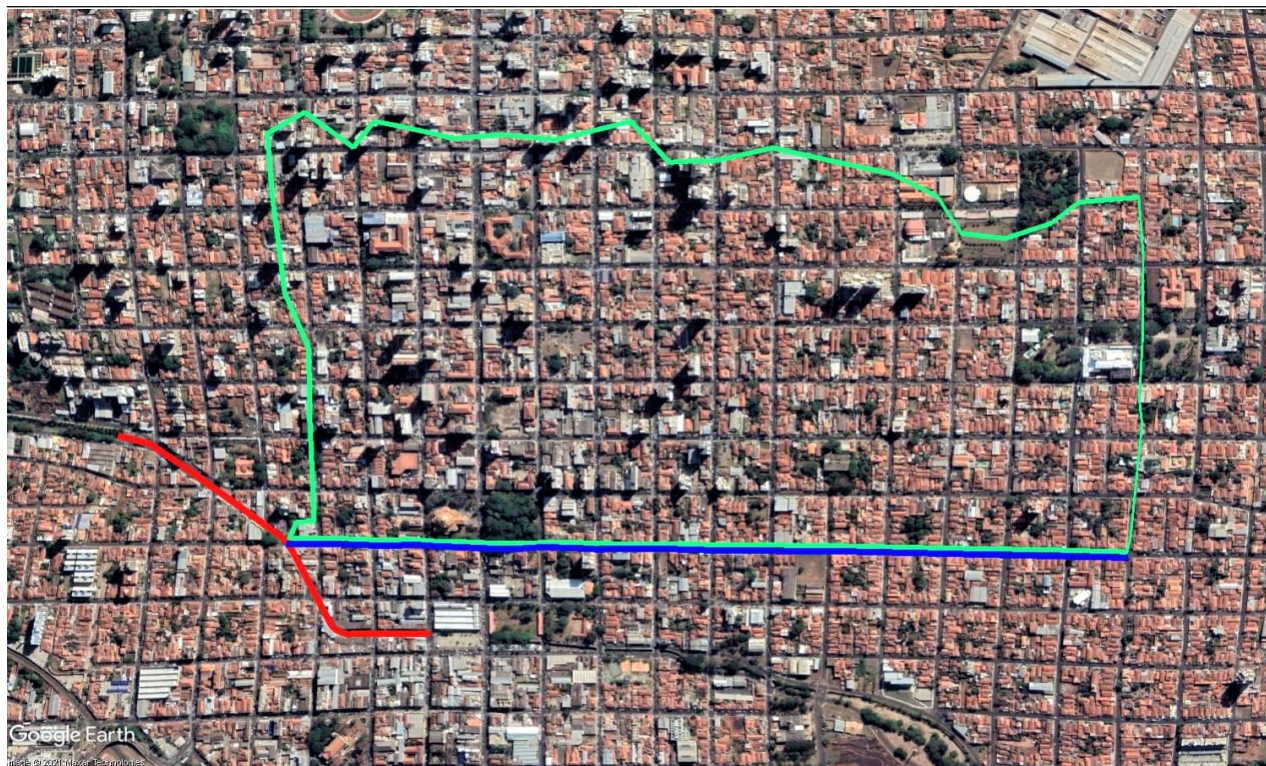
Figura 3 – Galeria na Rua Treze de maio (Linha Azul)

Apesar de muito debatido e possivelmente estudado tecnicamente em algum momento, não se sabe ao certo a viabilidade dessa obra, pois além de existir trechos da via com declividade contrária à declividade da pretendida galeria, ainda pode existir trechos com rochas no subsolo e outras interferências que podem inviabilizá-la, no entanto, entendemos que o maior problema dessa proposta é que a pretendida galeria conecta-se ao córrego do Gregório no trecho onde o mesmo se encontra subdimensionado, ou seja, tirando a água de uma região problemática e despejando-a num ponto igualmente crítico.