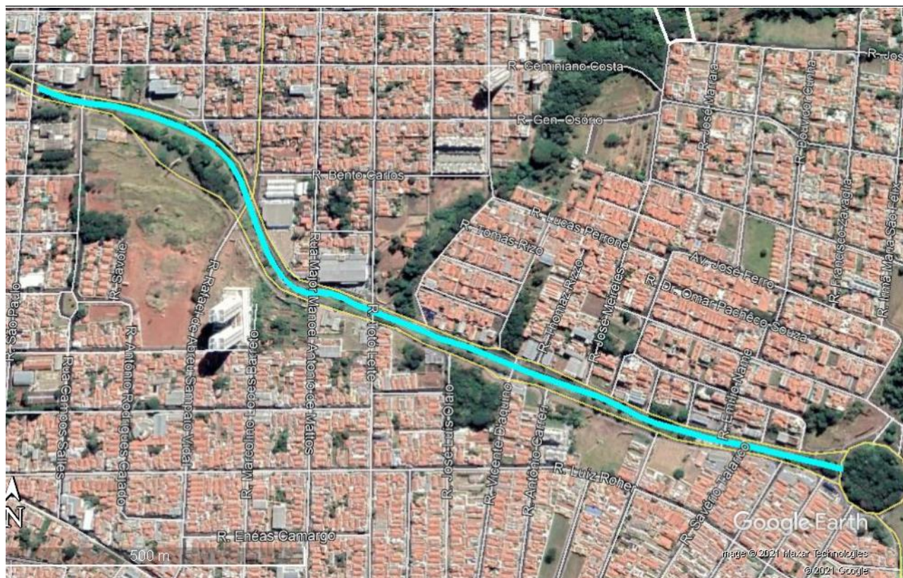
Figura 6 – Gregório destamponado.