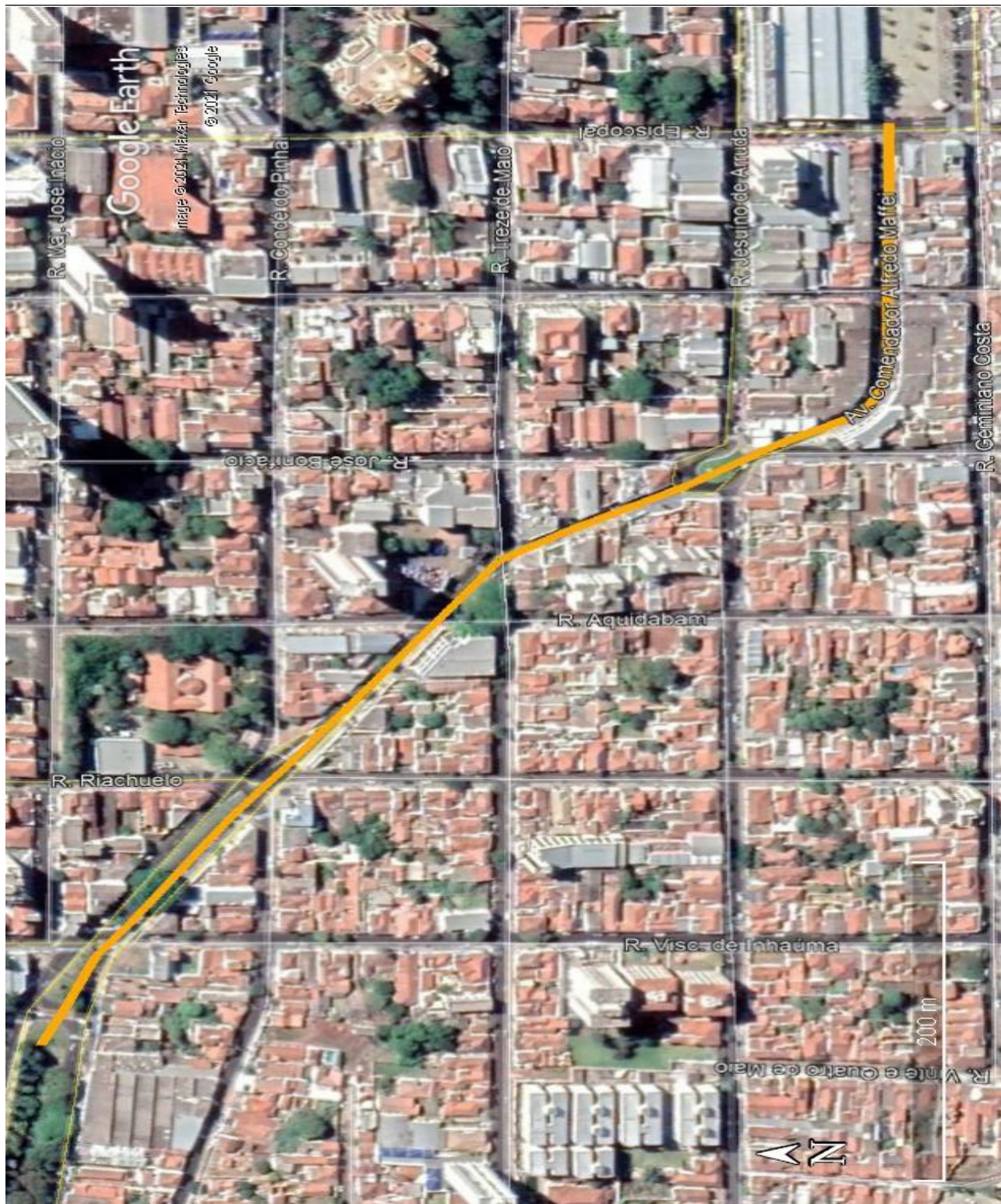
Figura 2 – Trecho subdimensionado do córrego Gregório (Linha Amarela)