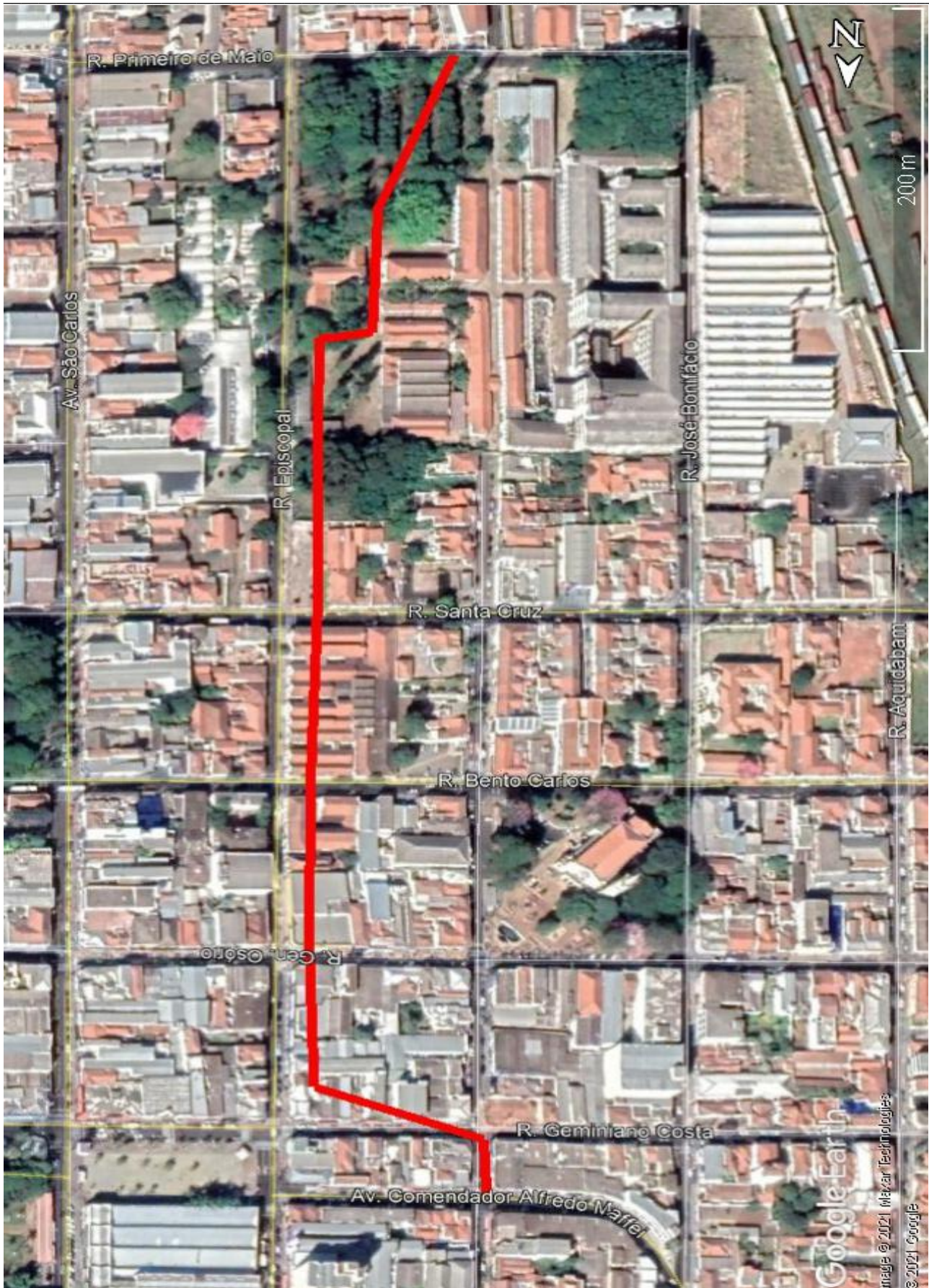
Figura 1 – Traçado do trecho subdimensionado do córrego Simeão (Linha vermelha)